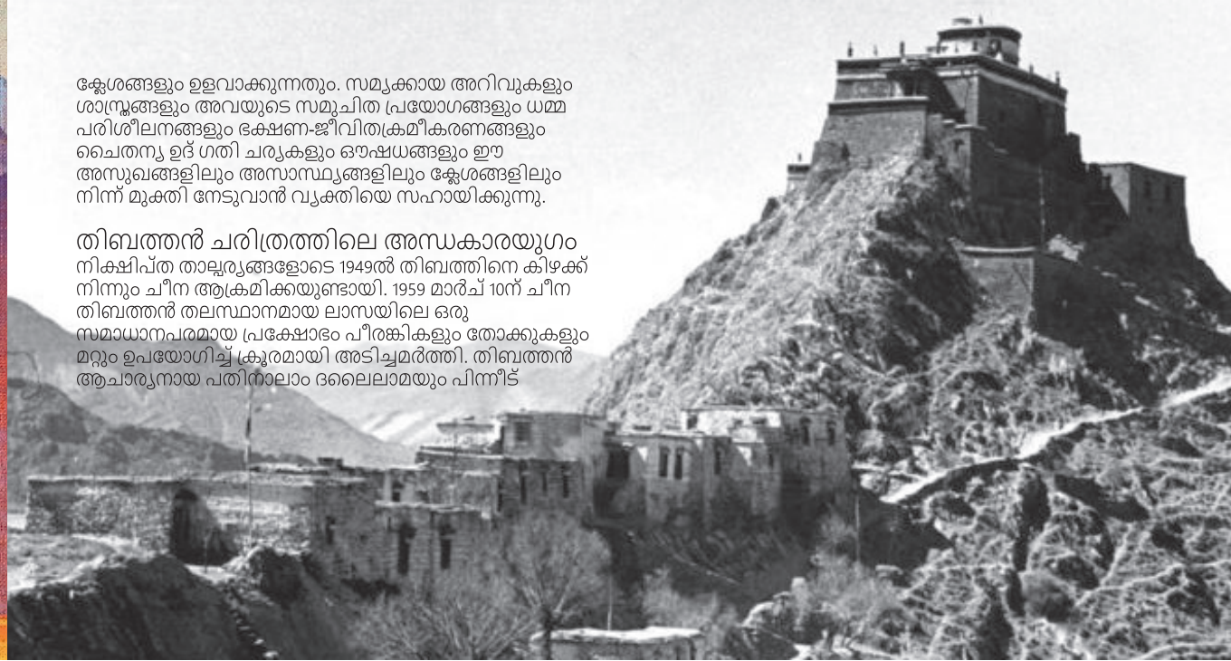
ചീനയുടെ അധിനിവേശത്തിനു മുൻപ് ചഗ്ലോരി മല മുകളിൽ നിലനിന്നിരുന്ന മെൻ-സെ-വാംഗ് (1938)

തിബത്തൻ ചരിത്രത്തിലെ അന്ധകാരയുഗം നിക്ഷിപ്ത താല്പര്യങ്ങളോടെ 1949ൽ തിബത്തിനെ കീഴടക്കി നിന്നും ചീന ആക്രമിക്കുകയുണ്ടായി. 1959 മാർച്ച് 10ന് ചീന തിബത്തൻ തലസ്ഥാനമായ ലാസയിലെ ഒരു സമാധാനപരമായ പ്രക്ഷോഭം പീരങ്കികളും തോക്കുകളും മറ്റും ഉപയോഗിച്ച് ക്രൂരമായി അടിച്ചമർത്തി. തിബത്തൻ ആചാര്യനായ പതിനാലാം ദലൈലാമയും പിന്നീട്